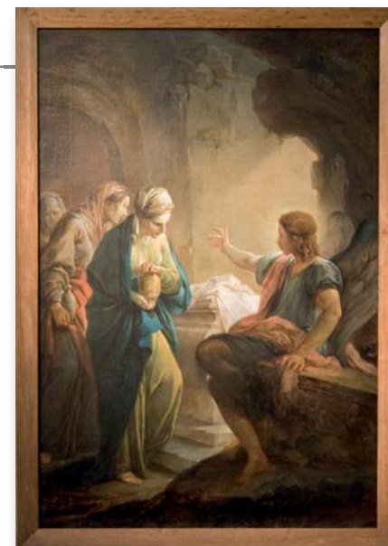
Frauen am Grab (französischer Maler, 18. Jahrhundert)

In der linken Bildhälfte sehen wir drei Frauen, die mit Vasen in den Händen einen höhlenähnlichen Raum betreten. Sie sind blass und bleich, wirken müde und erschöpft. Von rechts oben durch eine Öffnung fällt Licht in die Grotte. Vorne rechts im Bild sitzt ein junger, anmutiger Engel auf einer Grabplatte. Er erwartet die drei Frauen, schaut sie an und weist mit seinem rechten Arm wie beiläufig in die Bildmitte. Auf ein Grab. Ein weißes Tuch liegt auf dem steinernen Sarkophag, achtlos hingeworfen. Der Maler lässt das Licht genau auf dieses Tuch fallen, so dass der Blick des Betrachters automatisch auf diesen leuchtend weißen Fleck gelenkt wird.